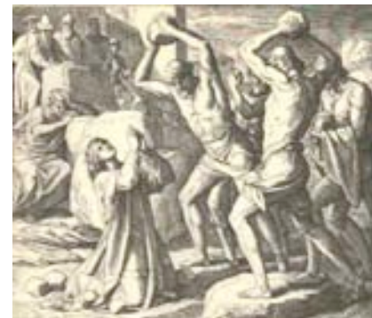
Stefanus bliver stenet

Vi bør tilgive os selv når Gud gør det. Vi bliver ikke mere retfærdige ved at lade være. Jesus siger at vi skal elske vor næste som os selv. Det indebærer at hvis vi tilgiver vor næste, hvad vi skal gøre, så bør vi også tilgive os selv. Vi må have et nådesforhold til os selv. □