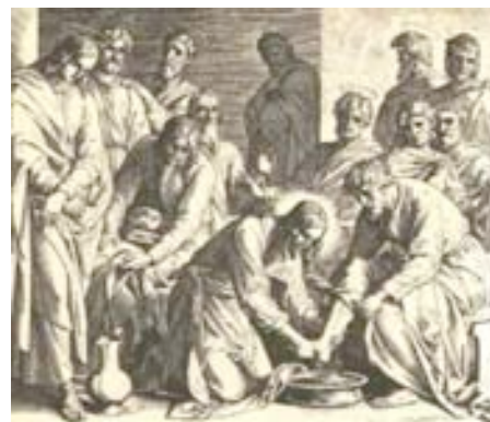
Jesu vasker disciplenes fødder (Johannes 13:4–9)

Man skal læse Det Gamle Testamente meget nøje for at forstå at Messias skulle komme to gange. Når vi i dag læser Det Gamle Testaments profetier, kan vi se hvilke Jesus opfyldte i sit første komme, og hvilke der venter på at skulle opfyldes, når han kommer igen. Han kom første gang for at vise hvordan man skulle leve et liv i kærlighed (nåde), mens han ved sin genkomst vil være kongernes Konge, der gør alting nyt. Gud er i sandhed både nådig og retfærdig. □