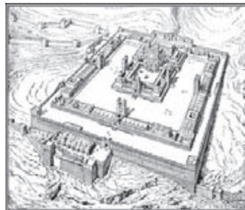
En tegning af templet, efter beskrivelsen af Ezekiels syn i Ezekiels bog kapitel 40–47.

Jeremias klager over Jerusalems skæbne. Men han bebrejder ikke Gud noget i den forbindelse, han klager over at Israels opførsel bevirkede at Gud måtte straffe dem. De tre første kapitler i bogen er en beskrivelse af Guds vrede over Israel og en beskrivelse af i metaforer (billeder) om ødelæggelsen. Gud er jo også en retfærdig Gud.