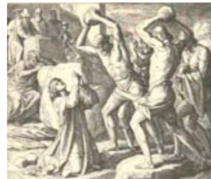
Stefanus bliver stenet

Vi bør tilgive os selv når Gud gør det. Vi bliver ikke mere retfærdige ved at lade være. Jesus siger at vi skal elske vor næste som os selv. Det indebærer at hvis vi tilgiver vor næste, hvad vi skal gøre, så bør vi også tilgive os selv. Vi må have et nådesforhold til os selv. □