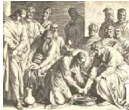
Jesus vasker disciplenes fødder (Johannes 13:4–9)

Man skal læse Det Gamle Testamente meget nøje for at forstå at Messias skulle komme to gange. Når vi i dag læser Det Gamle Testaments profetier, kan vi se hvilke Jesus opfyldte i sit første komme, og hvilke der venter på at skulle opfyldes, når han kommer igen. Han kom første gang for at vise hvordan man skulle leve et liv i kærlighed (nåde), mens han ved sin genkomst vil være kongernes Konge, der gør alting nyt. Gud er i sandhed både nådig og retfærdig. □