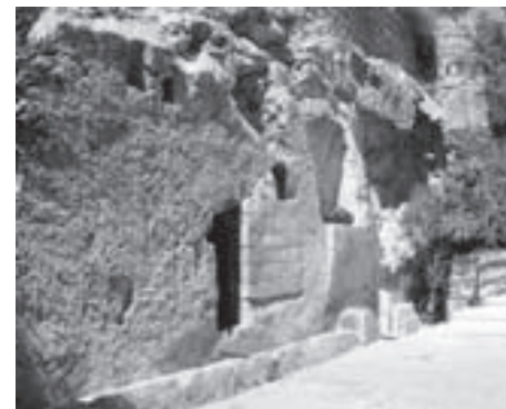
Graven i Getsemane-have, som nogen mener, er Jesu grav