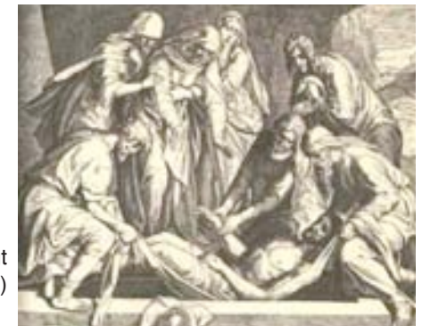
Jesu bliver gravlagt (John 19:31–42)