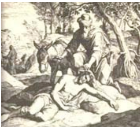
Den gode samaritaner

Stå i Guds kærlighed og hans nåde, så vil du opleve en dyb glæde og fred i dit liv. Der er kun én der kan fjerne dig fra det forhold, nemlig dig selv. For Gud ønsker denne nådespagt med dig. □