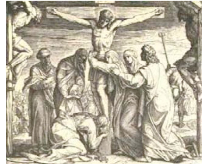
Jesu død på korset (John 19:18–30)

Jesu led og døde for at vise hvor stor kærlighed han har til os. Han gjorde det frivilligt. At Jesus døde i vort sted, viser hvor stor Guds nåde er. □