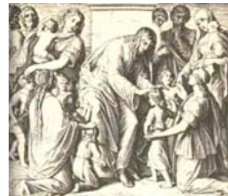
Jesus velsigner de små børn (Markus 10:13–16)

Og vi så hans herlighed, en herlighed, som den Enbårne har den fra Faderen, fuld af nåde og sandhed.