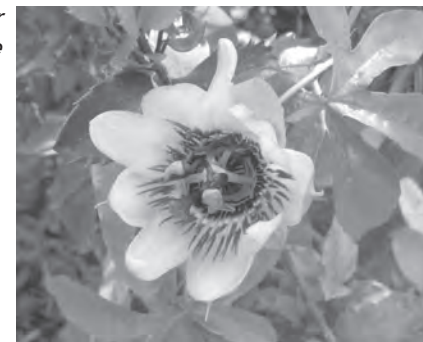
Passionsblomsten, som symboliserer Jesu lidelse

havde gemt sig. Han var interesseret i dem og kunne lide dem som hans børn. Det samme er tilfældet i dag. Gud er interesseret i dig. Det er Gud som tager initiativet til fællesskabet med os, fordi han ønsker at være sammen med sine børn.