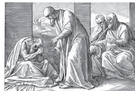
Job får besøg af sine tre venner

Vi lever ikke i Guds dimension, hvorfor vi ikke altid kan forstå ham. Også i dag kan det være en vanskelig opgave at leve sammen med Gud, da vi ikke kan vide, hvorfor han handler som han gør. Derfor er det sådan at vi tror på Gud i dag til trods for, at vi ikke altid forstår ham. Dette var netop Jobs og Abrahams erkendelse. Kristendommen handler ikke først og fremmest om at forstå Gud, men om at tro på ham. □