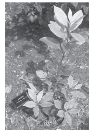
Laurbær, som anvendes til den sejrskrans, som Paulus skriver om i Første Korintherbrev 9:25

Gud har et helt specielt forhold til menneskeheden og holder af samværet med den. Han var villig