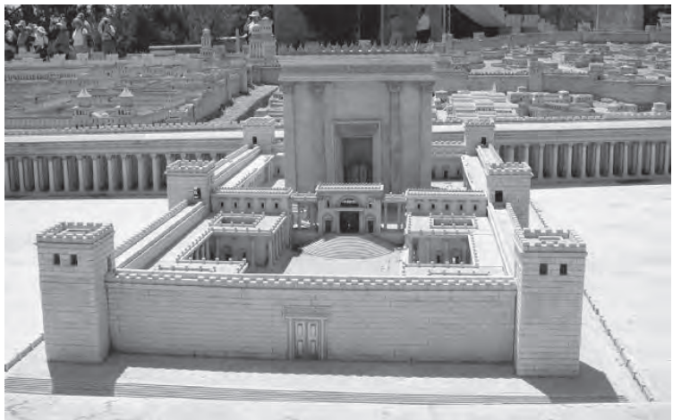
Model af Herodes' tempel i Jerusalem